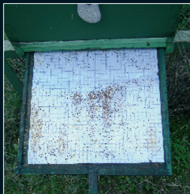
Foto 2.- Registrar los parásitos que caen de forma natural en un bandeja situada en el fondo de la colmena nos puede dar una idea muy aproximada del estado de parasitación de las abejas

Lejos de mejorar, la situación que está provocando varroa en nuestras colmenas no cesa de generar preocupaciones, cuando no es por el riesgo de que aparezcan residuos de los tratamientos en los productos de las abejas, es porque se detectan resistencias del ácaro a los tratamientos acaricidas, o por el daño que provoca el parásito en las colmenas, sin descartar que varroa pueda ser un origen indirecto de algunos de los casos de los que achacamos al “problema del despoblamiento”.