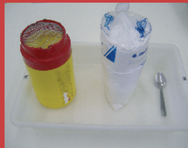
3.1.- Para realizar el diagnóstico necesitaremos un bote con la tapa recortada y una rejilla, una bandeja y azúcar en polvo