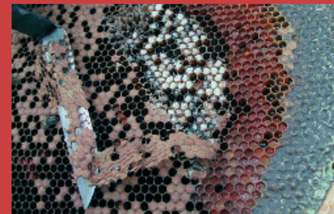
5.2.- Con un cuchillo corto de desopercular cortaremos los opérculos de una superficie que abarque aproximadamente 100 celdillas