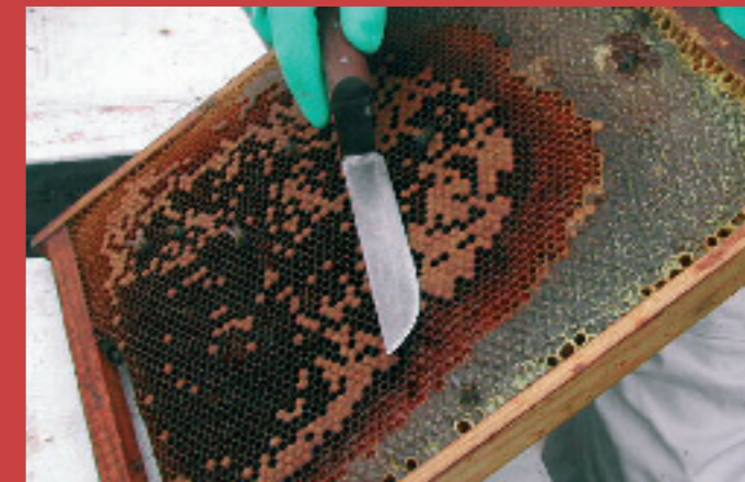
5.1. El diagnóstico lo haremos preferiblemente sobre el pollo de la parte superior delantera de un cuadro central de cría, intentando que sean pupas ya formadas blancas, en la que posteriormente nos será más fácil diferenciar los parásitos