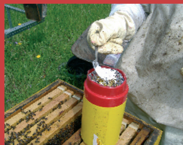
3.3.- Tapamos el bote y añadimos una cucharada sopera de azúcar en polvo