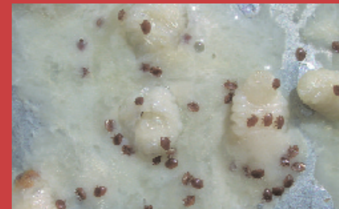
5.4.- Si la cría operculada aún no está formada (fase de larva o prepupa), nos será más difícil cuantificarla, pero podremos recurrir a contar el número de celdillas desoperculadas

DESPUÉS DE 25 AÑOS VISITANDO LAS CASAS DE NUESTROS LECTORES, AHORA LE INVITAMOS A LA NUESTRA