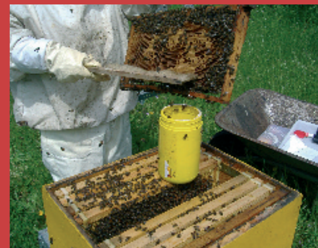
3.2.- Barreremos una muestra de abejas, preferiblemente de la zona central de cría