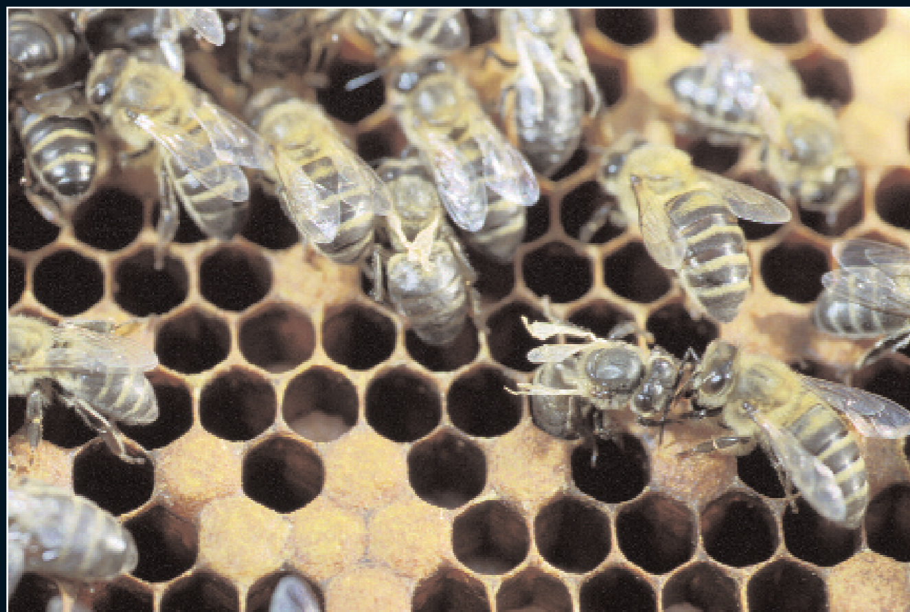
Foto 1- Las abejas con las alas dañadas son un signo de infestación. Si cuando examinamos las colmenas apreciamos con facilidad varias abejas dañadas y varroas, es probable que la infestación sea alta, y serán muchas más las varroas que no vemos