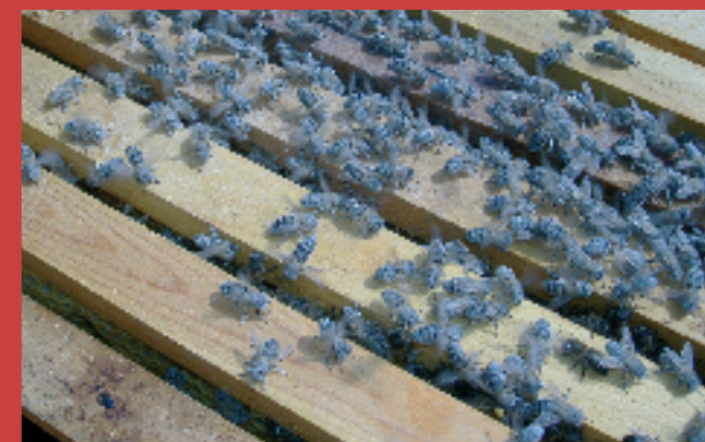
3.6.- Finalizado el diagnóstico devolvemos las abejas a su colmena