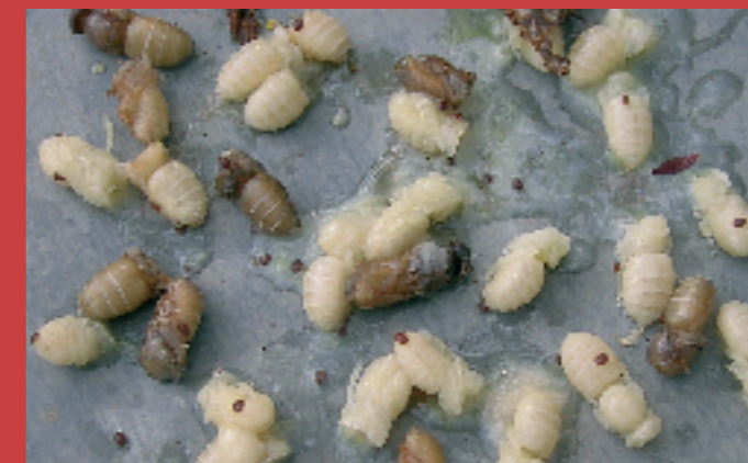
5.3.- Sacudiremos esta cría sobre una tapa vecina, donde podremos localizar y contar el número de varroas, así como la cría de la abeja