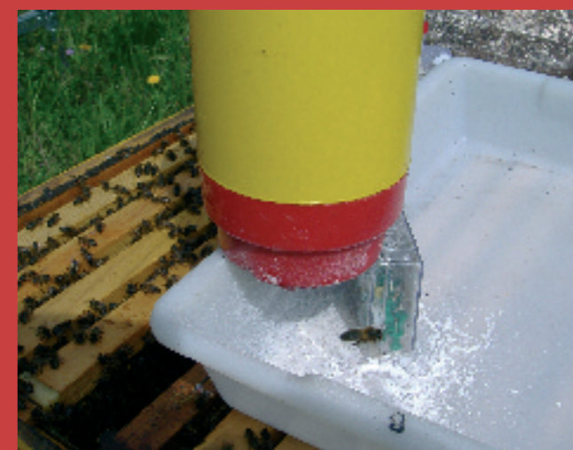
3.4.- Agitamos el bote y lo disponemos hacia abajo sobre la bandeja durante 5 ó 10 minutos